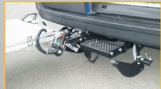
Option: Konsole Kugelkopfkupplung, schnelle und einfache Montage, auch nachrüstbar.